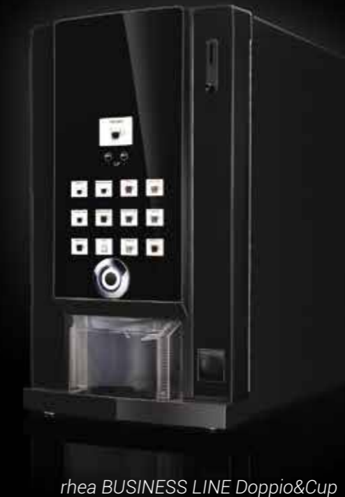
rhea BUSINESS LINE Doppio&Cup