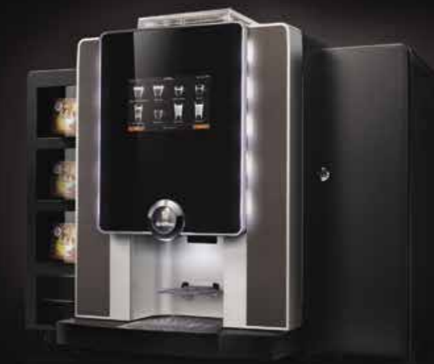
laRhea V+ grande 2 premium y rhMM1.v+