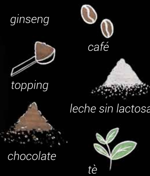
rhea BUSINESS LINE Ec y grande