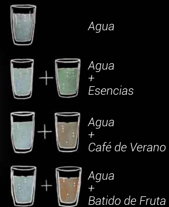
La familia de máquinas rhea COOL