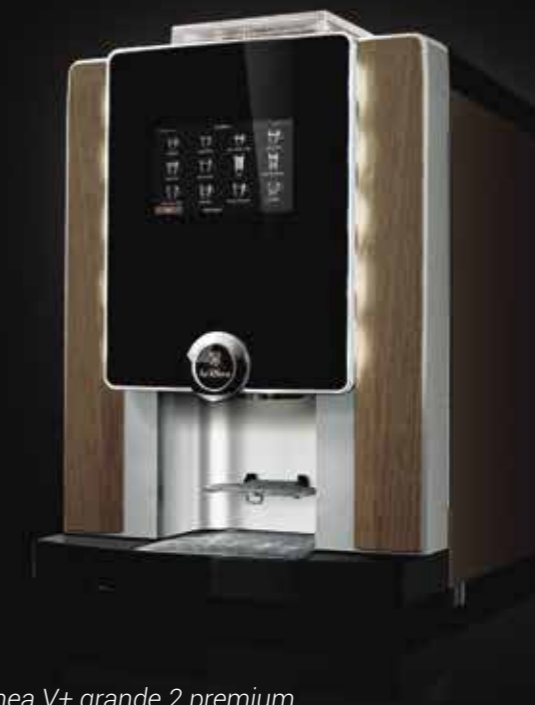
laRhea V+ grande 2 premium