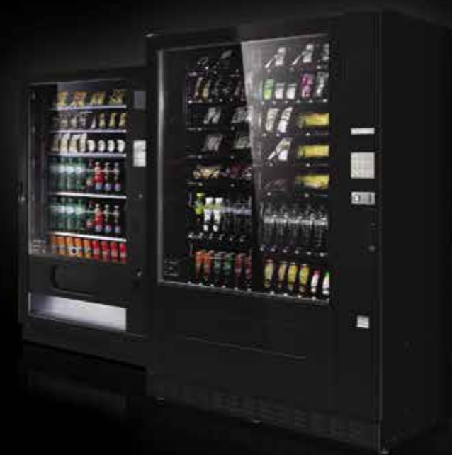
LXL6 multishop y snack saphirh