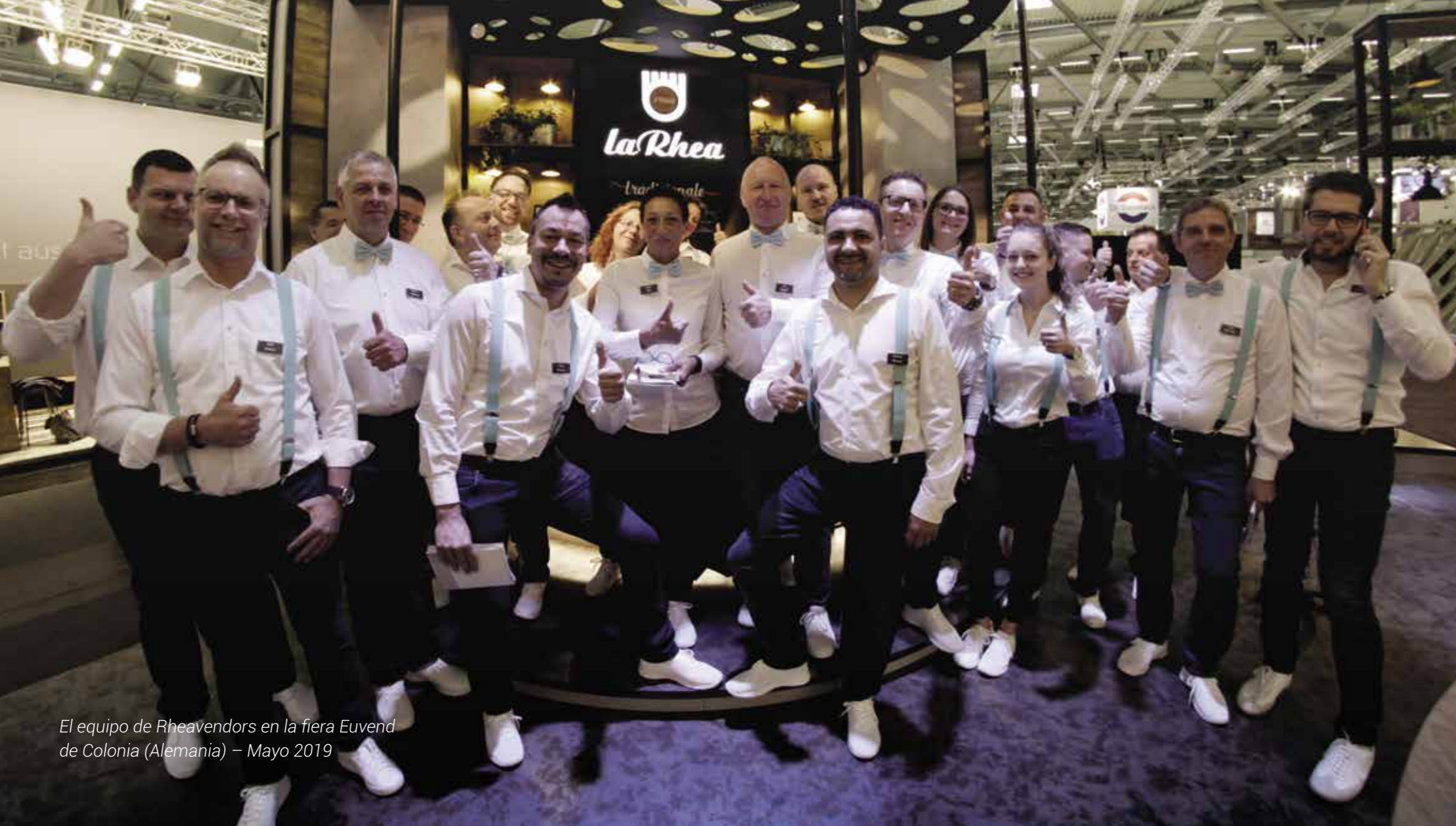
El equipo de Rheavendors en la feria Euvend de Colonia (Alemania) – Mayo 2019