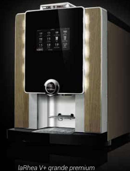
laRhea V+ grande premium